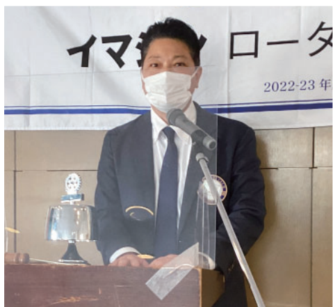
青少年活動委員長 長野会員