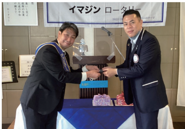
ロータリー財団よりバッジ進呈 三須会員